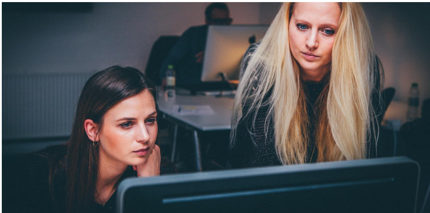
Andel av kommunala skatteintäkter per sektor, Osby kommun